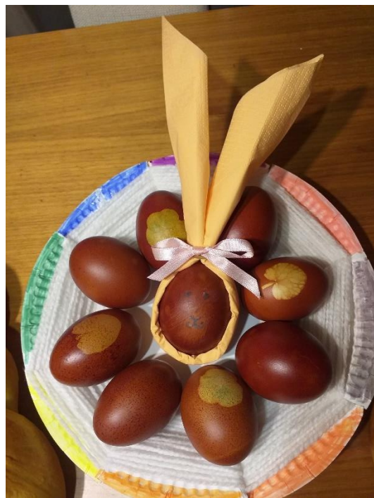
VID BAJZEK, 5.r – OŠ Kapela – 2019/20